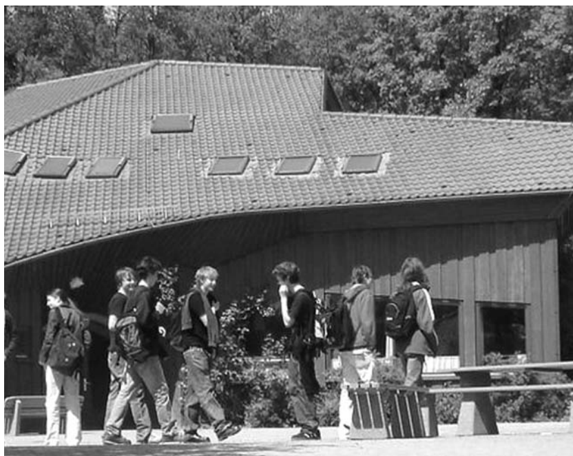
Млади хора, които се интересуват от биодинамичното земеделие, с удоволствие се записват в специализираните курсове на Земеделското училище в Голденхоф